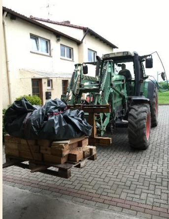
Am Burggarten angekommen,