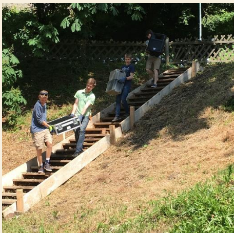
von Elektro Hankewicz aufgebaut und verkabelt.

Als nächstes kommt Licht- und Tontechnik,